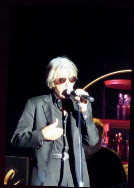
Les Vieilles Canailles le 4 juillet au CIR de Saint-Vulbas