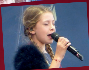
Kids United le 2 juillet au CIR de Saint-Vulbas