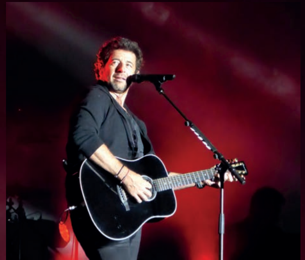
Patrick Bruel le 1 er juillet au CIR de Saint-Vulbas